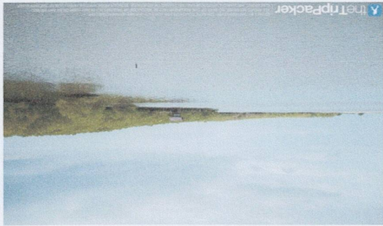
ถังกรองน้ำดื่มสะอาด

เทคโนโลยีการบำบัดน้ำดื่มสะอาดที่นำมาใช้มี 4 ระบบ ได้แก่