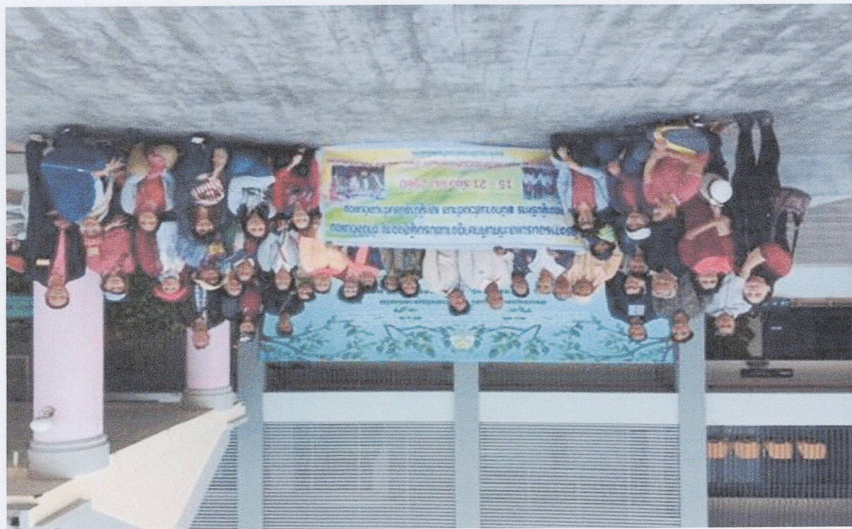
โครงการศึกษาวิจัยและพัฒนาสิ่งแวดล้อมแบบองค์รวมจากพระธาตุ