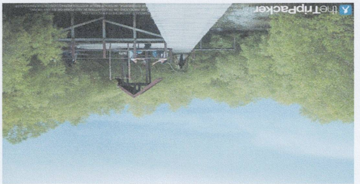
ถังกรองน้ำดื่มสะอาด

โครงการศึกษาวิจัยและพัฒนาถังกรองน้ำดื่มสะอาดในชุมชนเมือง 1.35 ไร่ สามารถบำบัดน้ำดื่มสะอาดได้ 1 ใน 5 ของเขตเทศบาล เมืองพระบุรี ซึ่งมีประชากรประมาณ 40,000 คน โดยน้ำดื่มสะอาดที่ผลิตขึ้น 40,000 ลิตรต่อวัน และประชาชนในชุมชนเมืองสามารถนำน้ำดื่มสะอาดไปใช้